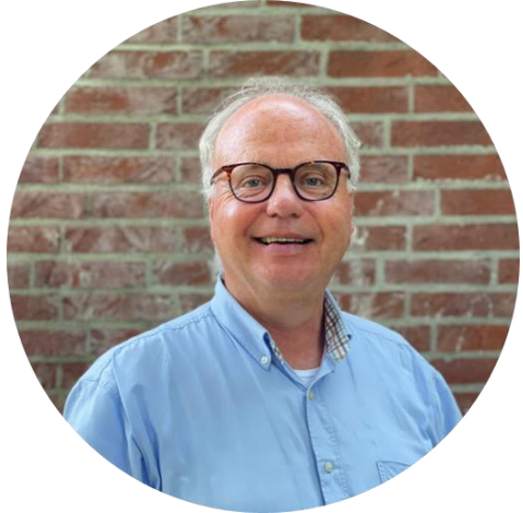
Meester Carles is er op: maandag, dinsdag, donderdag en vrijdag

Wil je liever met iemand anders praten die je helemaal niet kent, dan kan je de Kindertelefoon bellen. Telefoonnummer 0800-0432